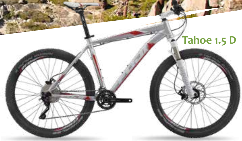
Tahoe 1.5 D