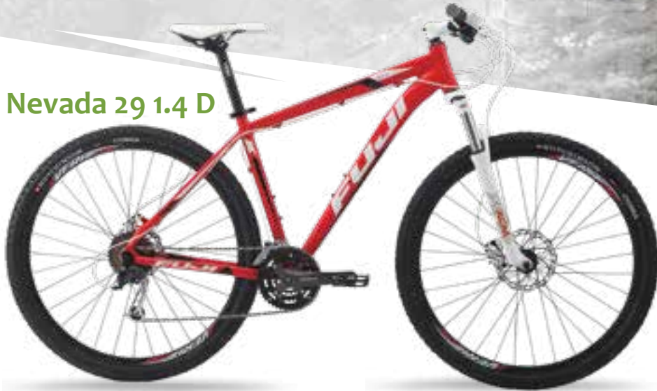
Nevada 29 1.4 D

این دوچرخه بسیار سبک و بادوام می باشد و به گونه ای طراحی شده که نیاز های شما را طی سال ها برآورده می کند. قطعات آن به درستی بر روی تنه ثابت شده و شکل ظاهری و هندسی آن نیز از دوچرخه SLM برای راحتی و دسترسی تمام سطوح دوچرخه سوار، اقتباس شده است.